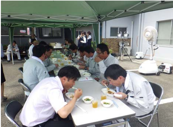
みんな仲良く飲食会