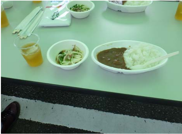
カレー・冷やしうどん