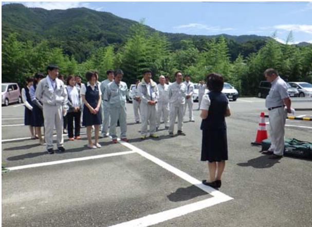
開会挨拶(総務班長)